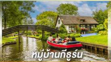
หมู่บ้านทึร์สุน