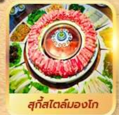
สุกีสโตลมองโก