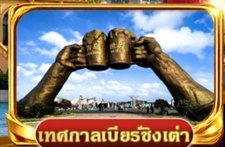
เทศกาลเบียร์ชิงเต่า