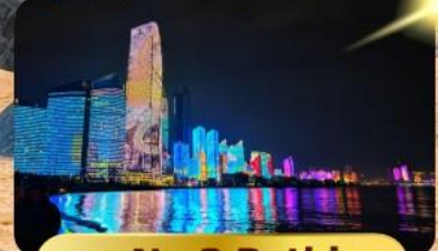
หาด No.3 Bathing

เมนูพิเศษ ซาบูสายพาน 6 วัน 4 คืน เดินทาง : พฤษภาคม 69