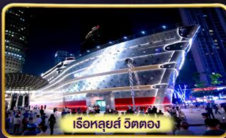
เรือหลุยส์ วัดตอง