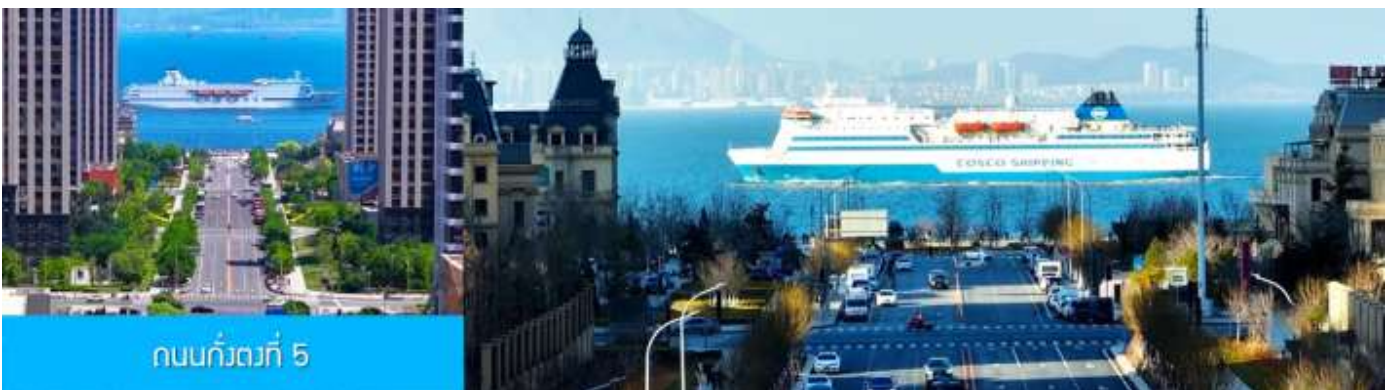
ถนนกังตง 5