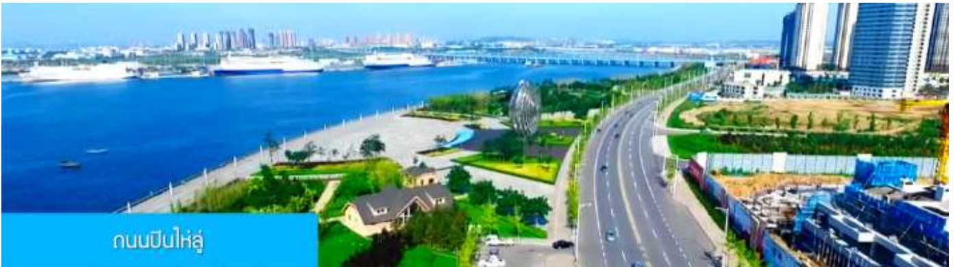
ถนนปินไห่หลู่

ล้อมด้วยตึกระฟ้าที่ทันสมัย ภายในมีบ่อน้ำพุคนตรี ลานหญ้าขนาดใหญ่ และลานกว้างสำหรับจัดกิจกรรม กลางแจ้ง อาทิ เทศกาลเบียร์นานาชาติ การแข่งขันวิ่งมาราธอน งานแฟชั่นนานาชาติเมืองต้าเหลียน ฯลฯ