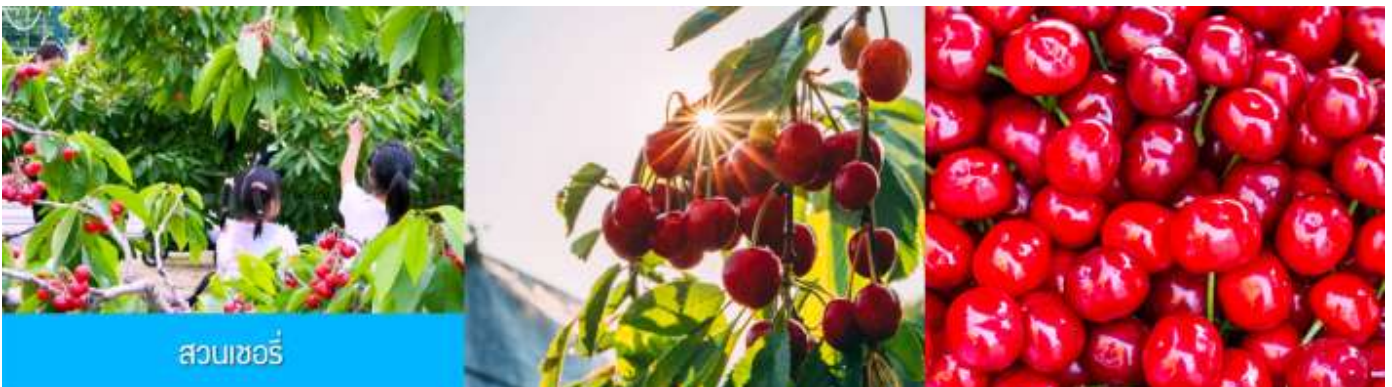
สวนเซอร์รี่

หลังอาหารเช้า นำท่านโดยสารรถบัสสู่ เมืองตันตง 丹东 (ระยะทาง 300 กม. ใช้เวลาเดินทางโดยรถบัส ประมาณ 3 ชั่วโมงครึ่ง)