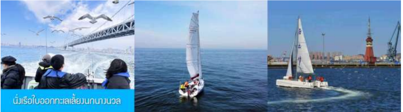
นั่งเรือใบออกทะเลลิ้นกนางนวล

ต่อด้วยนำท่านเที่ยวชมถนนรัสเซีย 俄罗斯风情街 ในอดีตที่นี่เป็นศูนย์ที่ตั้งของที่ทำการเมืองต้าเหลียน ภายหลังได้กลายเป็นชุมชนของพ่อค้าและวิศวกรทางรถไฟชาวรัสเซีย บริเวณนี้จึงเต็มไปด้วยอาคารบ้านเรือนแบบตะวันตก(รัสเซีย) มากมาย นอกจากนี้ได้เก็บภาพที่มีพื้นหลังเป็นอาคารสถาปัตยกรรมตะวันตก ที่นี้ยังมีร้านค้าที่จำหน่ายสินค้าและของที่ระลึกที่นำเข้ามาจากรัสเซีย อาทิ ช็อกโกแลต เหล้าวอดก้า ตุ๊กตารัสเซีย ฯลฯ