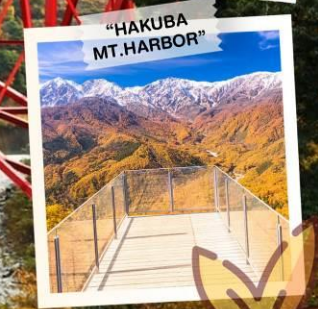
"HAKUBA MT. HARBOR"

วันเดินทาง 28 ต.ค. - 3 พ.ย. 2569 4 - 10 , 11 - 17 พ.ย. 2569