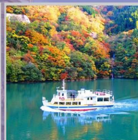
"SHOGAWA YURAN CRUISE"