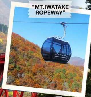
"MT. IWATAKE ROPEWAY"