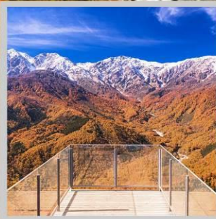
“HAKUBA MT. HARBOR”