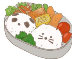
● อาหารสำหรับเด็ก ( 2-11 ปี ) *วัตถุดิบขึ้นอยู่กับทาว์ราน