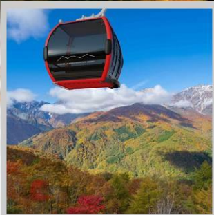
“MT. IWATAKE ROPEWAY”