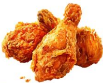
● ไม่ทานสัตว์ปีก (ไก่)