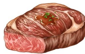
● ไม่ทานเนื้อหมู