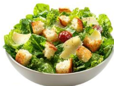
● ผักสดวิธีตี