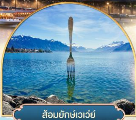
ส้อมยักเข่าเว่ย