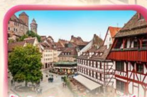
สัมผัสเมืองเก่าบูเรมเบิร์ก