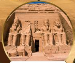
วิหารอาบูซิมเบล