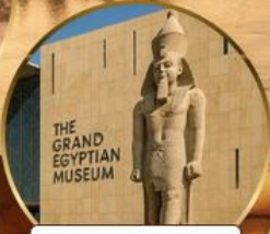
พิพิธภัณฑ์แกรนด์อียิปต์