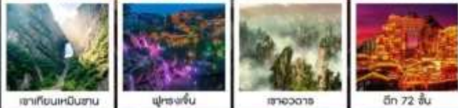
เขานิ่วเหมินซาน