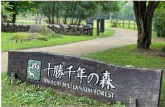
TOKACHI MILLENNIUM FOREST