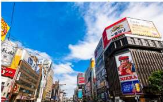
SHOPPING AT SUSUKINO

อิสระอาหารค่ำตามอัธยาศัย (ไม่รวมในรายการ)