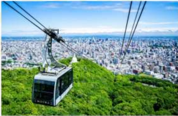
MT. MOIWA (CABLE CAR)