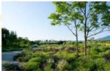
TOKACHI MILLENNIUM FOREST