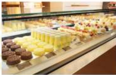
FURANO DELICE CAFE