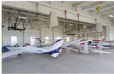
TAKIKAWA SKY PARK MUSEUM