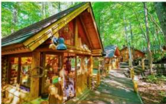
FURANO NINGLE TERRACE