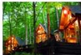
รับประทานอาหารค่ำ ภายในโรงแรม