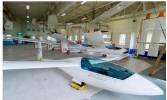
รับประทานอาหารกลางวัน ณ พิพิธภัณฑ์