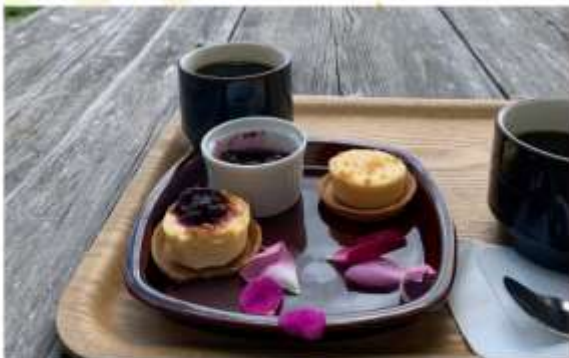
TOKACHI MILLENNIUM FOREST