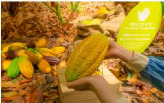
ROYCE CACAO & CHOCOLATE TOWN