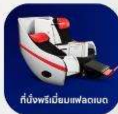
ที่นั่งพรีเมียมแพคเกจ