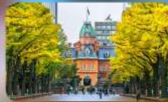
อัสระ-ตามอัสระ 1 วัน