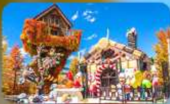
โรงงานช็อกโกแลต ชิโรอิ โคอิบิโตะ