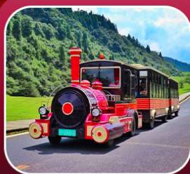
"อุทยานเขานางฟ้า"