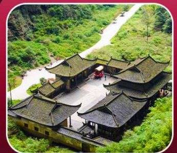
"อุทยานหลุมฟ้า"

T2G-CKG34(3U) The Best Chongqing...ฉงชิ่ง ต้าจู้ อุ่หลง เขานางฟ้า 5D 4N (3U)