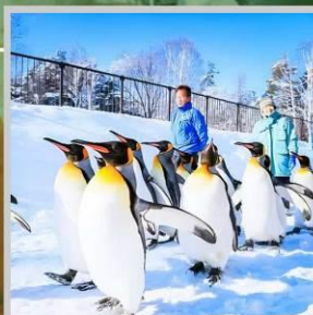
"PENGUIN ASAHIYAMA ZOO"