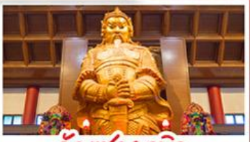
วัดแชกงเมียว