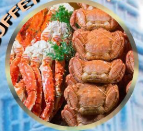
SAPPORO SNOW FESTIVAL 2027