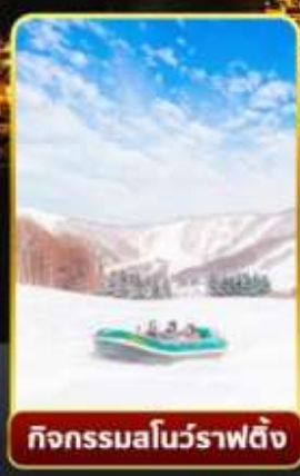
กิจกรรมโนว์ราฟติง