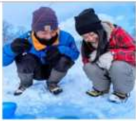
ตกปลาน้ำแข็งวากาซากิ