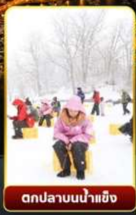
ตกปลาน้ำแข็ง