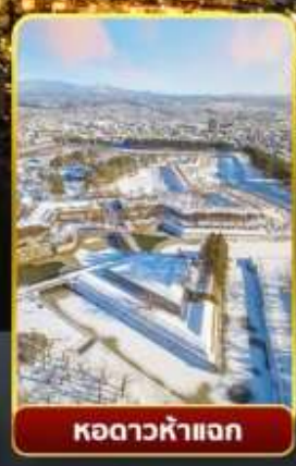
หอดาวห้าแฉก

🔥 ออนเซ็น 3 คั้น 🧳 มน.กระเป๋า 1 ใบ 23 กก 🌞 7Days 5Night