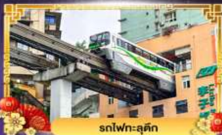
รถไฟฟ้า-สุตึก