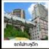
สถาปัตยกรรม