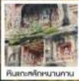
ศิลปะสถาปัตยกรรม