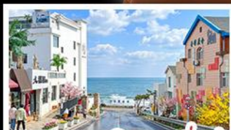
ถนนคอปเปลิ่งสาขาที่เปิด