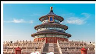
เจ้อฟ้าเทียนถาน

พระราชวังต้องห้าม - หอฟ้าเทียนถาน พิพิธภัณฑ์บีร์ซิงเต่า - ไรไวน์ - วาฬเคียวคาย