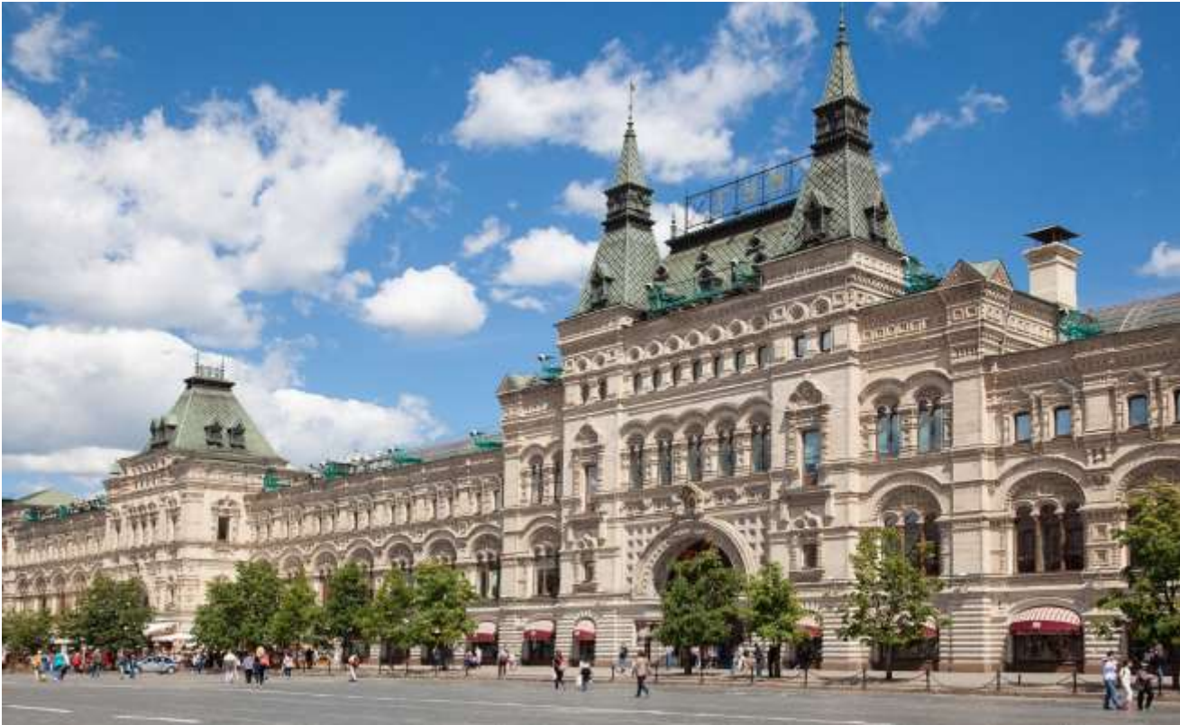
GUM DEPARTMENT STORE

เอกลักษณ์นี้ถูกสร้างขึ้นเพื่อเฉลิมฉลองชัยชนะอันยิ่งใหญ่ของรัสเซีย และยังคงตราตรึงในความทรงจำของผู้มาเยือนจากทั่วโลก ให้ท่านได้ข้อปิ้ง “ห้างสรรพสินค้ากุม” (GUM Department Store) ห้างสรรพสินค้าหรูหราเก่าแก่และใหญ่ที่สุดแห่งหนึ่งของกรุงมอสโก ตั้งอยู่ริมจัตุรัสแดง ตัวอาคารมีความงดงามด้วยสถาปัตยกรรมสไตล์นีโอคลาสสิกอันเป็นเอกลักษณ์ ภายในเต็มไปด้วยร้านค้าแบรนด์เนมระดับ