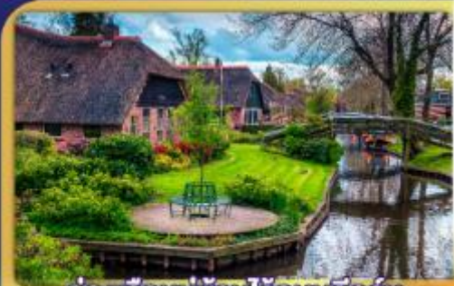
ล่องเรือหมู่บ้านไรทอนท์ธูร์น