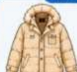
เสื้อโค้ทกันหนาว ตัวหนา