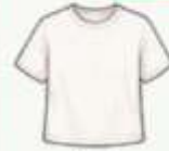
เสื้อยืด