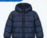
เสื้อขนเป็ด