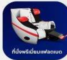
ที่นั่งพรีเมียมแพลนเบต