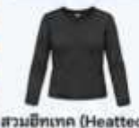
สวมฮีตเทค (Heattech) แบบหนาพิเศษด้านใน