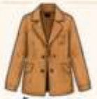
เสื้อแจ็กเก็ต หรือโค้ทตัวยาว