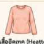
สวมเสื้อฮีตเทค (Heattech) ไว้ด้านในเพื่อเพิ่มความอบอุ่น แทนการใส่เสื้อหลายๆ ชั้น