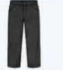
พร้อมกางเกงขายาว