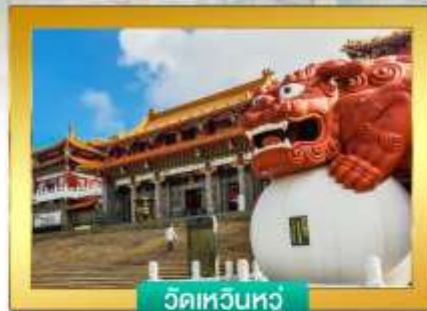
วัดเทวินหัว