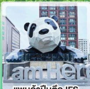
แพนด้าป็นตึก IFS