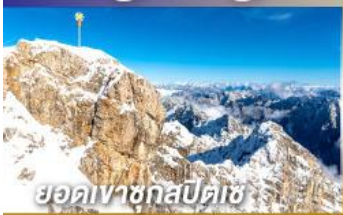
ยอดเขาชุกสปีตเซ