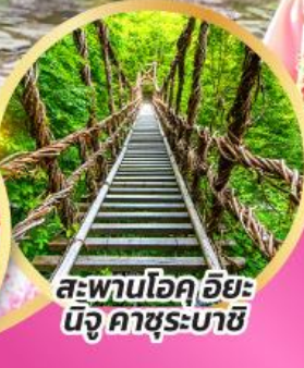
สะพานโอคุฮิยะ นิจู คาซุระบาชิ