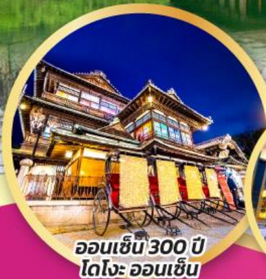
ออนเซ็น 300 ปี โตโจะ ออนเซ็น