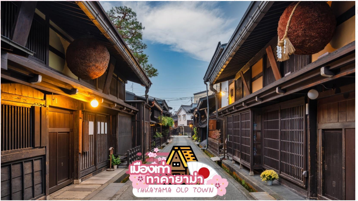
เมืองเก่า ทาคายามา TAKAYAMA OLD TOWN

สะพานนากะบาชิ (Nakabashi Bridge) สะพานสีแดงของย่านเมืองเก่า สะพานทอดข้ามแม่น้ำมิกากา วะที่ไหลผ่านใจกลางเมือง สะพานแห่งนี้ถือเป็นสัญลักษณ์ของเมืองทาคายามา (ซากุระขึ้นอยู่กับ สภาพอากาศ)