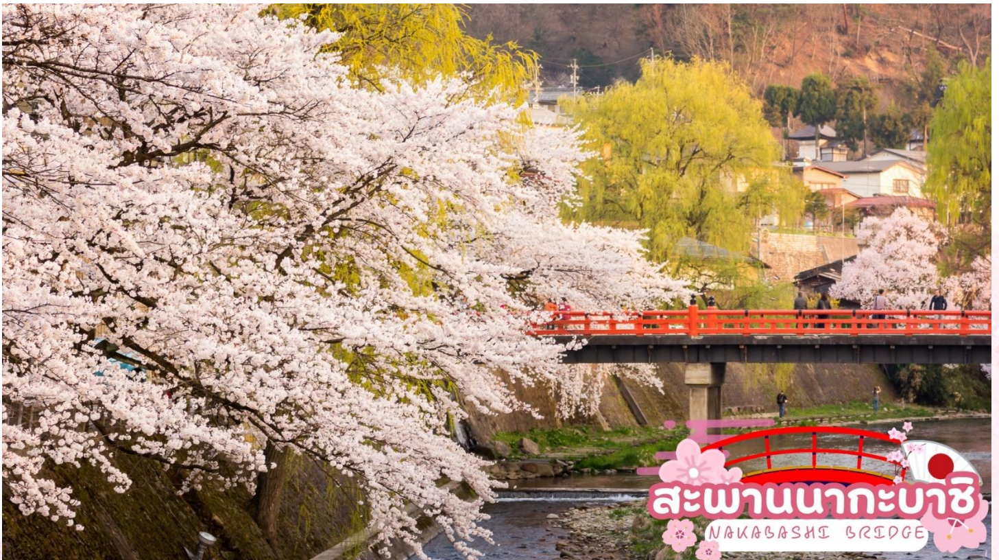
สะพานนากะบาชิ NAKABASHI BRIDGE

สะพานนากะบาชิ (Nakabashi Bridge) สะพานสีแดงของย่านเมืองเก่า สะพานทอดข้ามแม่น้ำมิกากา วะที่ไหลผ่านใจกลางเมือง สะพานแห่งนี้ถือเป็นสัญลักษณ์ของเมืองทาคายามา (ซากุระขึ้นอยู่กับ สภาพอากาศ)