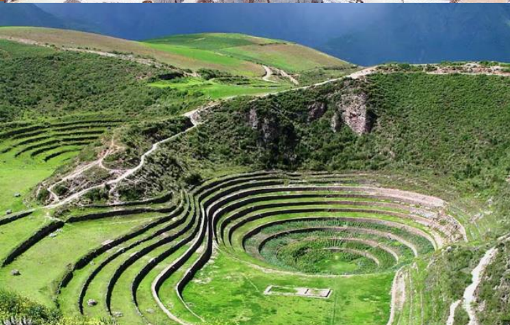
บ่าย นำท่านเดินทางสู่ มาราซ (Maras) แหล่งผลิตเกลือที่คุณภาพดีที่สุดในโลก ที่มีมาตั้งแต่สมัยอินคา แนวนาขั้นบันไดที่เรียงอยู่ตามลำดับความสูงของภูเขา จากนั้นเดินทางสู่ โมเรย์ (Moray) นาขั้นบันไดวงกลมขนาดใหญ่หลายๆรูปร่างแปลกตาที่ชาวอินคาทำไว้เพื่อทดลองปลูกพืชพันธุ์ต่างๆ จากจุดนี้สามารถมองเห็น หมู่บ้านอูร์บบัมบา (Urubamba) ได้อีกด้วย ได้เวลาเดินทางกลับสู่เมือง เมืองคัสโก (Cusco) เมืองหลวงของอาณาจักรอินคา ที่แพร่ขยายอำนาจจนกินพื้นที่ 1 ใน 3 ของอเมริกาใต้ ตั้งอยู่เหนือระดับน้ำทะเลถึง 3,400 เมตร และเป็นแหล่งอารยธรรมยุคก่อนประวัติศาสตร์ที่ลึกลับน่าทึ่ง เป็นชุมชนเก่าแก่ของจักรวรรดิอินคาอันรุ่งเรือง ซึ่งยังคงทิ้งร่องรอยความเจริญไว้ให้เห็นเป็นซากปรักหักพังโบราณและโบราณวัตถุต่างๆ