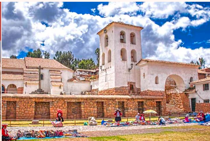
เที่ยง บริการอาหารกลางวัน ณ ภัตตาคาร Hanka Restaurant