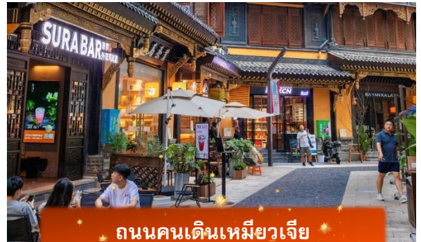
ถนนคนเดินเหมียวเจีย

เที่ยง บริการอาหารกลางวัน ณ ภัตตาคาร พิเศษ ... เมนูเปิดปักษ์