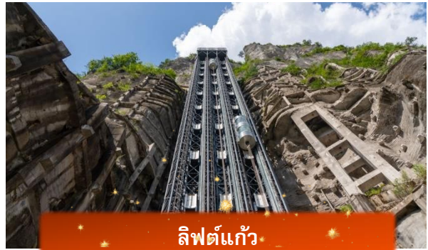
ลิฟต์แก้ว