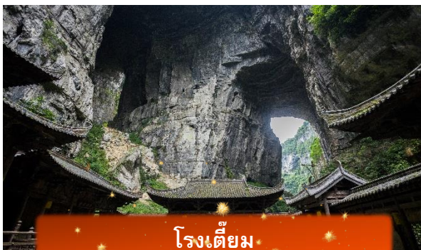
โรงเตี๊ยม

นำท่านลง ลิฟต์แก้ว สู่หุบเหวลึก 80 เมตร ชมกลุ่มสะพานสวรรค์ – สะพานหินธรรมชาติใหญ่ที่สุดในเอเชีย 3 แห่ง ได้แก่ สะพานมังกรสวรรค์ มังกรเฉียว และมังกรดำ ท่ามกลางธรรมชาติสุดอลังการ พร้อมแวะโรงเตี๊ยมโบราณฉากจริงจากภาพยนตร์ “ศึกโค่นบัลลังก์วังทอง” รวมค่าลิฟท์ 1 เที่ยว