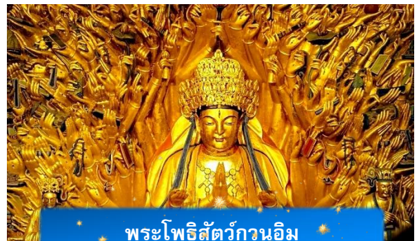
พระโพธิสัตว์กวนอิม

นำท่านเดินทางสู่ มรดกโลกอุทยานผาหินแกะสลักต้าจู่ ศิลปะหินแกะสลักอันล้ำค่าแห่งเมืองฉงชิ่งมรดกโลกที่องค์การยูเนสโกขึ้นทะเบียนเมื่อปี ค.ศ. 1999 ตั้งอยู่ทางตะวันตกของนครฉงชิ่ง ประเทศจีน ศิลปะหินแกะสลักเหล่านี้สร้างขึ้นตั้งแต่ราชวงศ์ถังจนถึงราชวงศ์ซ่ง มีอายุมากกว่า 1,000 ปี โดดเด่นด้วยงานแกะสลักทางพุทธศาสนาที่งดงามและยังคงสภาพสมบูรณ์ (ใช้เวลาเดินทางประมาณ 1-2 ชั่วโมง)