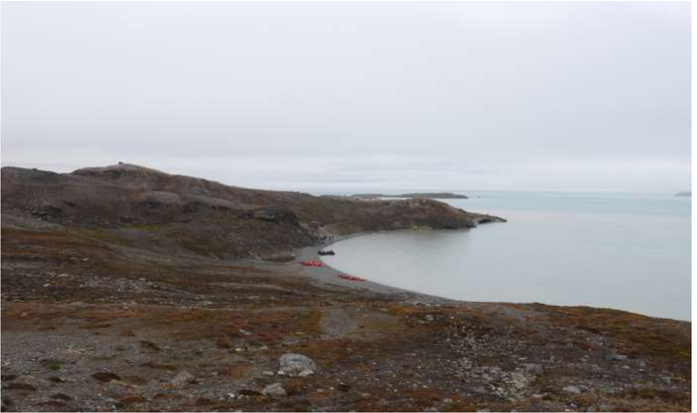
เขตอนุรักษ์ธรรมชาติซอร์ราสต์ (Soraust Svalbard Nature Reserve)

เป็นเกาะขนาดเล็กทางตอนเหนือของสวาลบาร์ด มีพื้นที่เนินเขาเตี้ยๆและอยู่ใกล้กับธารน้ำแข็งทางตอนเหนือของสวาลบาร์ดอีกด้วย ที่นี่ได้รับการขนานนามว่า อ่าวแห่งรัก (Love Bay) ท่านจะได้ชื่นชมทัศนียภาพและความสวยงามของอ่าว รวมถึงสัตว์ไม่ว่าจะเป็นหมีขาว แมวน้ำ ที่มีถิ่นอาศัยในบริเวณนี้เช่นกัน