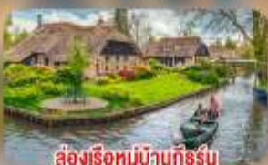
ล่องเรือหมู่บ้านทึร์น