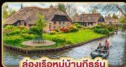
ล่องเรือหมู่บ้านกังหัน