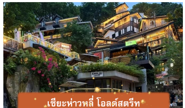
เขี้ยวหัวหลี่ โอลด์สตรีท

ที่พัก HOLIDAY INN EXPRESS HOTEL เทียบเท่าหรือระดับ 4 ดาวท้องถิ่น