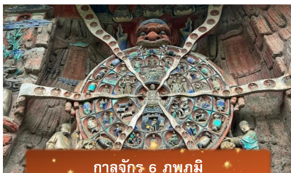
กาลจักร 6 ภพภูมิ

หลังจากนั้นนำท่านเดินทางกลับ เมืองฉงชิ่ง