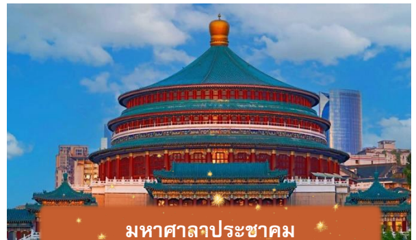
มหาศาลาประชาชน