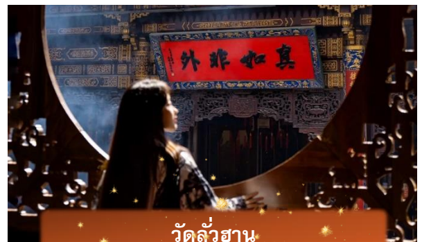
วัดลั่วฮาน