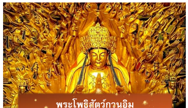
พระโพธิสัตว์กวนอิม

เช้า บริการอาหารเช้า ณ ห้องอาหารของโรงแรม นำท่านเดินทางสู่ มรดกโลกอุทยานผาหินแกะสลักต้าจู้ ศิลปะหินแกะสลักอันล้ำค่า แห่งเมืองฉงชิ่งมรดกโลกที่องค์การยูเนสโกขึ้นทะเบียนเมื่อปี ค.ศ. 1999 ตั้งอยู่ทาง ตะวันตกของนครฉงชิ่ง ประเทศจีน ศิลปะหินแกะสลักเหล่านี้สร้างขึ้นตั้งแต่ราชวงศ์ถัง จนถึงราชวงศ์ซ่ง มีอายุมากกว่า 1,000 ปี โดดเด่นด้วยงานแกะสลักทางพุทธศาสนาที่ งดงามและยังคงสภาพสมบูรณ์ (ใช้เวลาเดินทางประมาณ 1-2 ชั่วโมง)