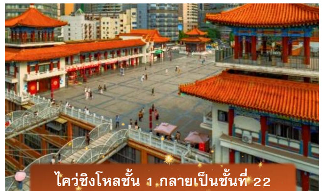
ไควซิงโหลชั้น 1 กลายเป็นชั้นที่ 22

นำทุกท่านสู่ ตลาดหงหยาดัง ซุปเปอร์มอลล์ขนาดยักษ์ในรูปแบบสถาปัตยกรรมจินโบราณที่เป็นทั้งตลาดของกิน แหล่งช้อปปิ้ง และจุดชมวิวยามแม่น้ำเจียหลิงที่นี่เปรียบเสมือนอีกหนึ่งแลนด์มาร์กที่ต้องมาให้ได้เมื่อมาเยือนนครฉงชิ่งให้ท่านได้เพลิดเพลินกับการถ่ายภาพและเลือกซื้อของฝากตามอัธยาศัย เพลิดเพลินไปกับการถ่ายรูปกับสถาปัตยกรรมที่สวยงาม