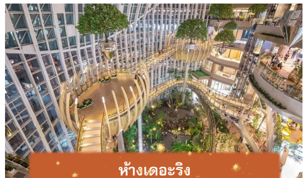
ห้างเดอะริง

นำท่านอิสระ ห้างเดอะริง แลนด์มาร์กช้อปปิ้งและไลฟ์สไตล์สุดล้ำของฉงชิ่ง ที่ผสมผสานความทันสมัยกับธรรมชาติอย่างลงตัว ภายในโดดเด่นด้วย Rainforest Dome โชนป่าฝนจำลองขนาดใหญ่ใจกลางห้าง รายล้อมด้วยร้านค้าแบรนด์ดังระดับโลก ร้านอาหารหลากหลายสไตล์ และพื้นที่จัดแสดงศิลปะสุดสร้างสรรค์ เหมาะสำหรับทั้งช้อปปิ้ง เดินเล่น และถ่ายภาพสวย ๆ