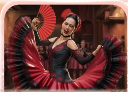
ระบำฟลามิงโก