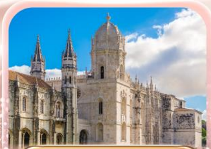
มหาวิหารจอร์นโบ