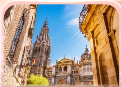
มหาวิหารแห่งโกเอลดา