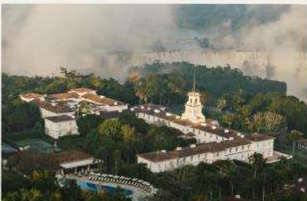
Hotel das Cataratas, A Belmond Hotel