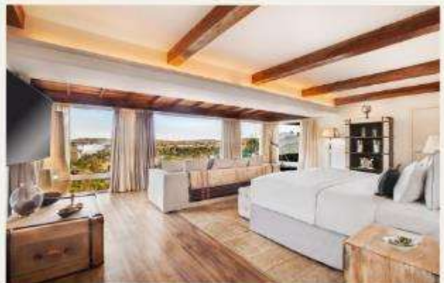
Gran Meliá Iguazú Argentina Side